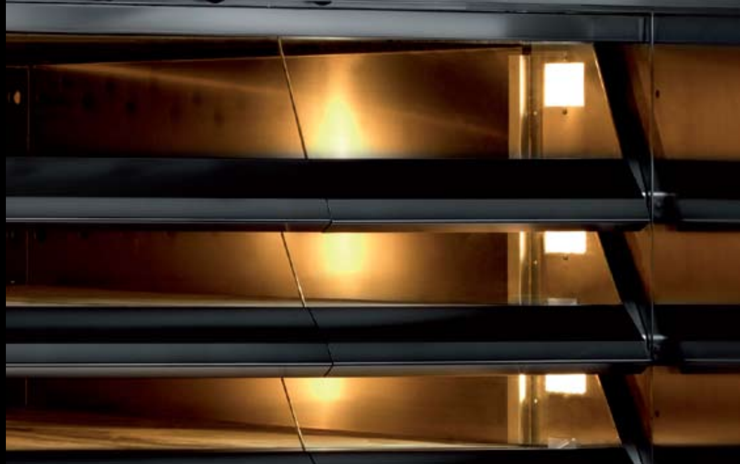
PREMIUM version avec portes abattantes en vitre

Le four est disponible sur demande avec portes en inox ou en vitre, pour répondre aux exigences de panification des différents marchés.