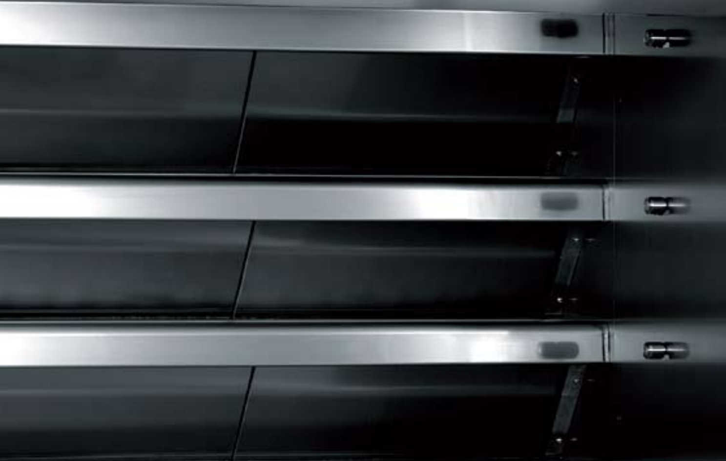
PREMIUM version avec portes relevantes en acier inox